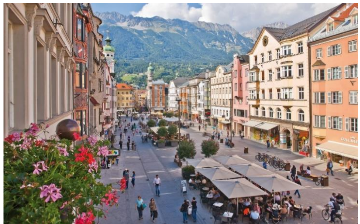
Innenstadt von Innsbruck